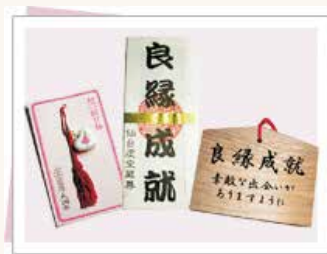
良縁三点セット (良縁祈禱の方に差し上げます)